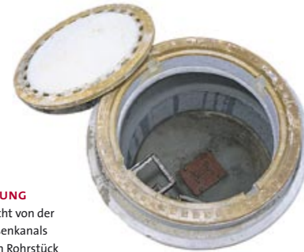
Übergabeschacht des Hauskastens außerhalb des Gebäudes

Die Grundleitung und der Übergabeschacht (Einsteigschacht) dürfen vom Kunden erst gebaut werden, wenn von den Berliner Wasserbetrieben der Hausanschlusskanal hergestellt ist. Den Schacht muss der Grundstückseigentümer bauen lassen. Er muss gemäß DIN 1986-100 einen Innendurchmesser von mindestens einem Meter haben. Neben den bisher üblichen Werkstoffen Beton und Mauerwerk können dafür auch bestimmte Fertigteilschächte aus