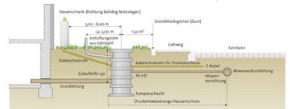
Druckentwässerung – Hausanschluss

Entwässerungskanäle werden entweder in offener Bauweise oder durch unterirdischen Rohr- bzw. Schildvortrieb verlegt. Beim unterirdischen Vortrieb werden die neuen Rohre von einem Startschacht durch das Erdreich bis zum Zielschacht gepresst, das Erdreich wird zutage gefördert. Auch Hausanschlusskanäle können so gebaut werden. Das Verfahren ist in Fachkreisen als "Berliner Bauweise" bekannt. Dabei werden die Anschlusskanäle sternförmig an die Start und Zielschächte oder an Hilfsschächte herangeführt, um Straßenaufbrüche zu reduzieren.