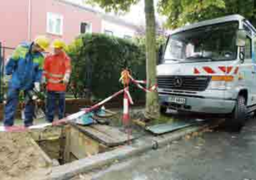
Bau eines Hausanschlusses an die Wasserversorgung