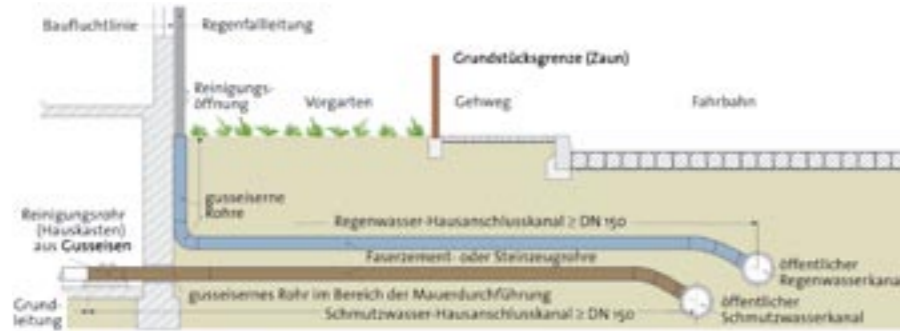
Abwasserentsorgungsleitung – Reinigungsrohr im Gebäude