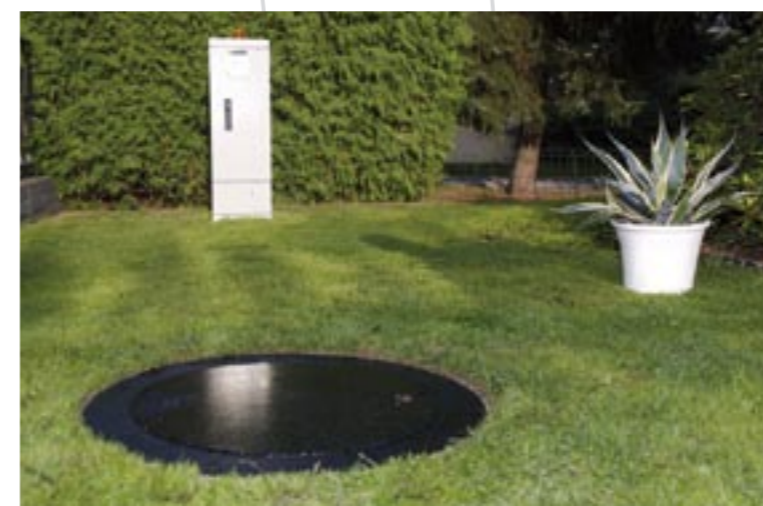
Druckentwässerungsanlage, Einbaubeispiel, im Hintergrund der Steuerschrank

In Berlin wurden bisher mehr als 600 km Straßen- und Hausanschlusskanäle in grabenloser Bauweise hergestellt.