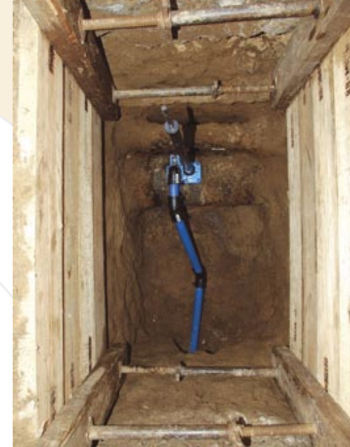
Anschluss an eine Trinkwasserversorgungsleitung

Anschlussleitungen, die über das Grundstück Dritter führen, müssen durch eine Grunddienstbarkeit grundbuchlich gesichert werden. Für die Eintragung ist jeder Grundstückseigentümer oder die Eigentümergemeinschaft selbst verantwortlich.