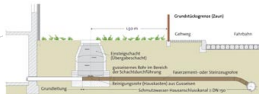
Abwasserentsorgungsleitung – Reinigungsrohr außerhalb des Gebäudes

Der Pumpenschacht liegt in der Regel 1,50 m hinter der Grundstücksgrenze. Der Anschluss der Grundleitung auf dem Grundstück an den Pumpenschacht erfolgt als Gefälleleitung. Die Grundleitung darf erst dann durch den Grundstückseigentümer gebaut werden, wenn der Druckentwässerungsanschluss durch die Berliner Wasserbetriebe hergestellt ist. Die Unterkante des Einlaufs am Schacht liegt ca. 1,20 m unter Geländeoberkante. Auf Grund des vorhandenen Standardmaßes des Schachtes lassen sich an dieser Einlauftiefe nur geringfügige Änderungen vornehmen.