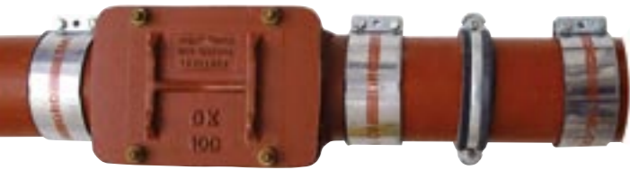
Hauskasten für den Hausanschluss innerhalb des Gebäudes